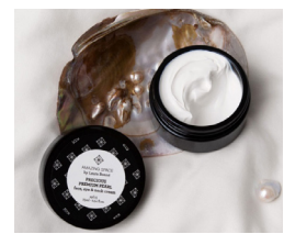
Wintercare creme koster fra 375,- kr til 950,- kr.