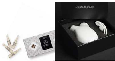
Ansigtsstimulator 695,- kr