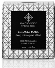
Miracle frugtsyre mask 550,- kr

Amazing Space har alle disse lækre produkter: